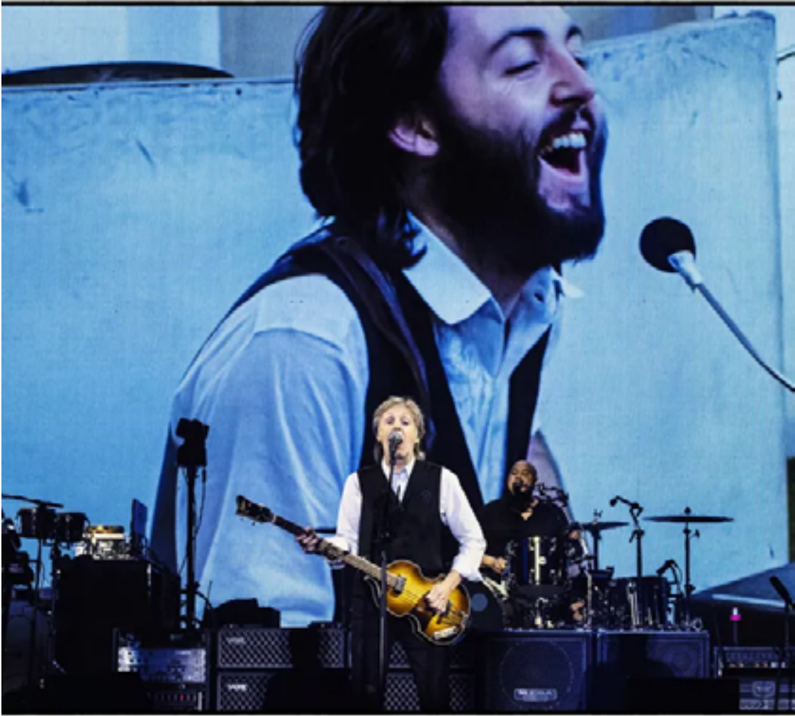
Paul McCartney toca o indefectível baixo Höfner, ano passado, no Festival de Glastonbury: turnê de despedida