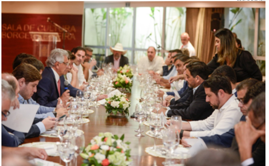
Ronaldo Caiado se encontra com deputados da base aliada para discutirem projetos como 2ª etapa do Goiás em Movimento-Eixo Municípios

Os deputados aproveitaram a ocasião para reforçar apoio ao projeto de reajuste do Im-