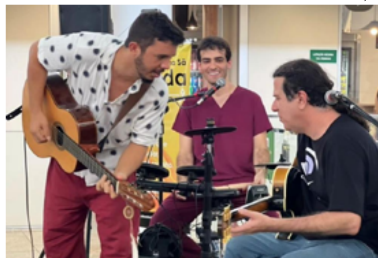
Palco aberto: iniciativa dispõe de microfone para quem quiser mostrar talento

Fundado em 1997, o Instituto Olhos da Alma Sã é uma organização não-governamental sem fins lucrativos que promove prevenção em saúde mental, oferece formação para psicólogos com prática inclusa em sua clínica escola, proporciona supervisão clínica para psicoterapeutas e disponibiliza à comunidade atendimento em psicoterapia humanizado, de qualidade, com valor social. Desde sua fundação, o Instituto atende a milhares de usuários de todas as regiões do Brasil e do exterior.