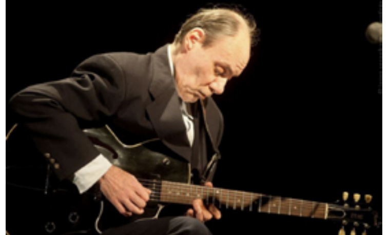
Mestre: músico deixou gravados arranjos que transformaram a música