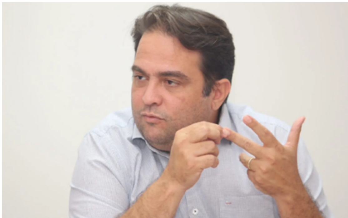
Roberto Naves: união dos partidos de direita para enfrentar o PT de Lula em 2024

berto Naves surpreendeu o meio político ao trocar o Progressistas pelo Republicano e, de imediato, assumir a presidência estadual do partido. De imediato, iniciou conversações para buscar candidatos a prefeito em grandes cidades, além de Goiânia, que já tem Rogério Cruz.