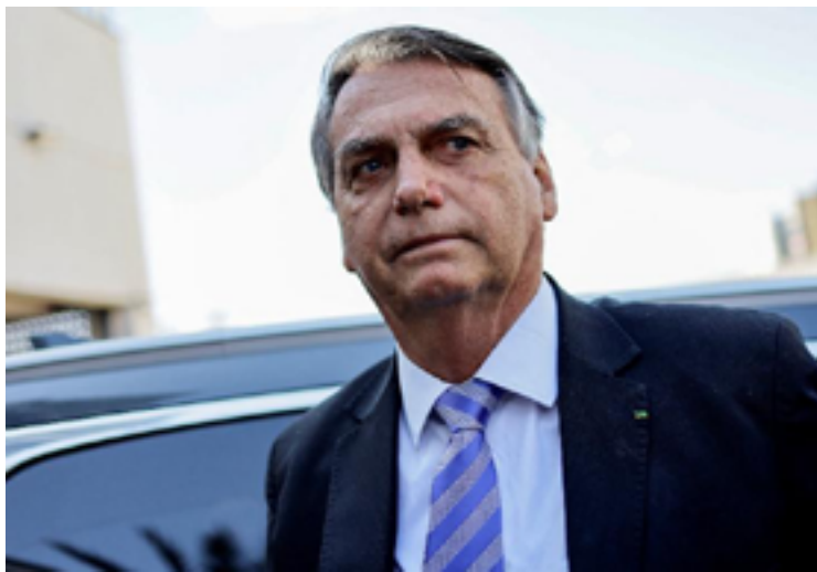
Jair Bolsonaro: processos não terão voto de Flávio Dino