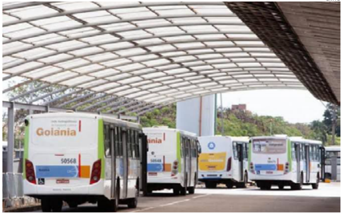
Início de padronização de pontos de ônibus começam em dezembro na Capital

bém vão adotar medidas para a realização de investimentos na renovação, operação e manutenção da infraestrutura de transporte do Eixo Anhanguera, bem como na obtenção, operação e manutenção de veículos elétricos. A previsão é de que sejam concluídas as obras de revitalização dos terminais do Eixo Anhanguera até o final de 2024.