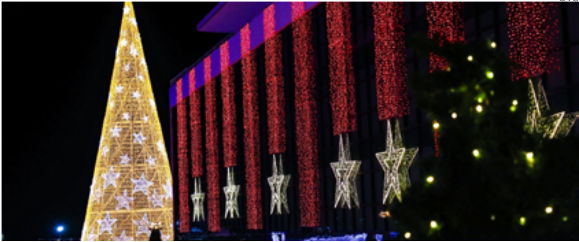
Natal do Bem tem mais de dois milhões de pontos de luz e uma árvore de natal de 40 metros

Magia natalina está presente em diversos cantos da Capital. Veja locais interessantes para visitar